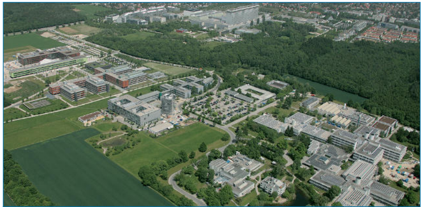
Abb.1: Campus Großhadern / Martinsried ■

Mehrfach habe ich bereits über die Aktivitäten des Bayerischen Forschungsnetzwerks für Molekulare Biosysteme, kurz als BioSysNet bezeichnet, berichtet. Das Netzwerk ist Teil des Bayerischen Forschungszentrums für Molekulare Biosysteme (BioSysM) – beide Projekte werden zu großen Teilen durch das Bayerische Staatsministerium für Bildung und Kultus, Wissenschaft und Kunst gefördert. Diese zwei Programme zur Molekularen Biosystemforschung in Bayern sind nicht unwesentlich beteiligt an den großen Veränderungen, die aktuell auf dem Campus der LMU in Großhadern/Martinsried zu beobachten sind. Die dort entstehenden Neubauten umfassen das im Oktober 2015 eingeweihte Biomedizinische Forschungszentrum und zum Anderen den gerade in der Fertigstellung befindlichen Forschungsneubau BioSysM, der im März 2016 seine Arbeit aufnehmen wird. Neben diesen beiden neuen Zentren wurde im Mai 2015 das Centrum für Schlaganfall und Demenzforschung (CSD) am Klinikum Großhadern in Betrieb genommen. Alle drei Gebäude sind architektonisch so ausgelegt, dass das Prinzip Offenheit nicht nur verkündet, sondern auch in der Kommunikation der Wissenschaftler konkret umgesetzt werden kann. (Abb. 1) All diese Programme und die neu erstellten Gebäude sollen dazu beitragen, den Campus zu einem Brennpunkt der interdisziplinären biotechnologischen Forschung weiter zu entwickeln. Die fächerüber-