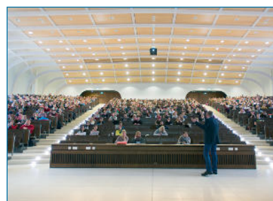
Abb. 7: Audimax BMC bei der Einweihung, (Bildquelle: LMU) ■

Naturwissenschaftler auf die neue Ära der quantitativen, systemorientierten Biowissenschaften vorbereitet. Den Doktoranden wird ein Programm an der Schnittstelle von Experiment und theoretischer Analyse, von der Biochemie, Bioinformatik und Strukturbiochemie über Medizin und Physik bis hin zur Mathematik geboten. Der thematische Schwerpunkt der Graduate School liegt auf der Kontrolle der Genexpression und dem Zusammenspiel verschiedener Kontrollmechanismen in regulatorischen Netzwerken. Die Aufgabe des