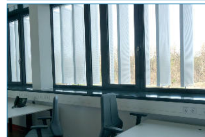
Abb. 5 a und b: Laborräume BioSysM, (Bildquelle: Dittmar ©BioSysNet / LMU) ■

Platz für wissenschaftliche Veranstaltungen ist reichlich vorhanden, neben dem Konferenzsaal für etwa 100 Personen und dem vollvernetzten Präsentationsraum für 30 Teilnehmer im Erdgeschoß sind auf jedem Stockwerk noch einmal kleinere Seminar- und Besprechungsräume. Das Herzstück der Bioinformatik, der Serverraum und die Anlagen der Gebäudeversor-