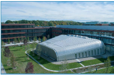
Abb. 8: Audimax BMC Außenansicht ■

BMC ordnen sich um einen großzügigen grünen Innenhof, der durch die Sonderform des Audimax geprägt wird. (Abb. 8)