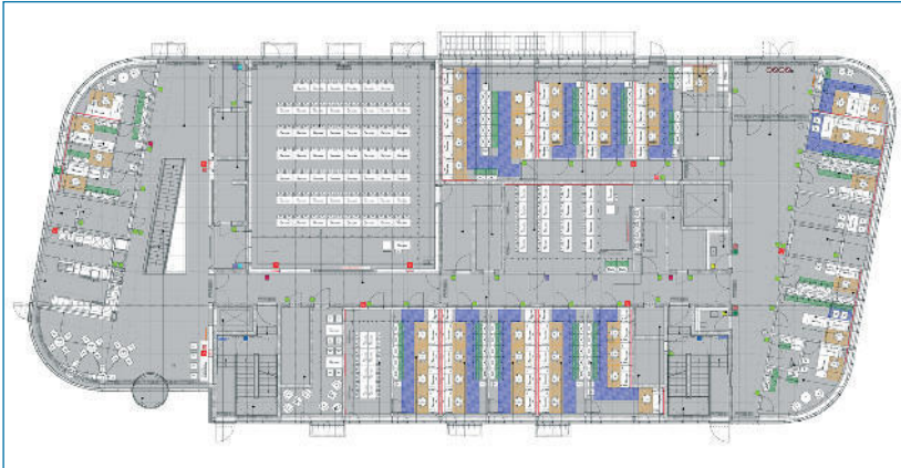
Abb. 3: Plan Erdgeschoss BioSysM, (Bildquelle: Prof. Ulrike Gaul ©LMU) ■

in München, dem Bauamt der Universität München und dem Architektenteam Fritsch + Tschaidse ein beeindruckender Neubau für die Wissenschaftler von BioSysM. Das Gebäude überzeugt nicht nur rein technisch – da ist es absolut auf dem neuesten Stand – sondern auch durch die großzügige offene Bauweise. Das weiträumige und einladende Treppenhaus mündet in breite Inseln, die zum Sitzen und zum Gespräch zwischen Kollegen animieren. „Es war uns ein Anliegen, reichlich Platz für informelle Treffen zu schaffen“ erklärt Pro-