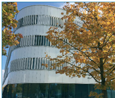
Abb. 2: Neubau BioSysM Außenansicht ■

greifende Zusammenarbeit zwischen verschiedenen biowissenschaftlichen und medizinischen Arbeitsgruppen ist für eine detailliertere Kenntnis der grundlegenden Funktionen und Steuermechanismen von lebenden Systemen