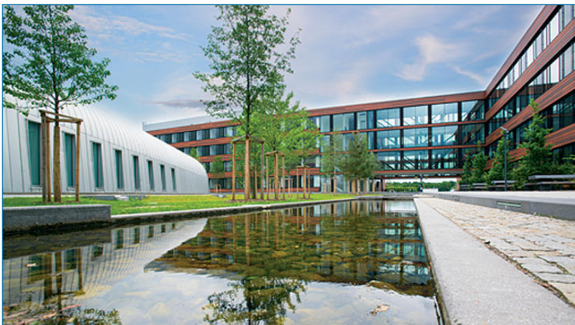
Abb. 6a und b: Biomedizinisches Centrum Außenansicht, (Bildquelle: C. Olesinski ©LMU) ■

gung, befinden sich in den großzügig und hell gestalteten Kellerräumen. Dabei wird die Abwärme sowohl von den Serverräumen wie auch von den Räumen, in denen die -80^{\circ}\text{C} Gefrierschränke untergebracht sind, wieder in die Wärmerversorgung rückgeführt. So entsteht ein umweltfreundlicher Energiekreislauf.